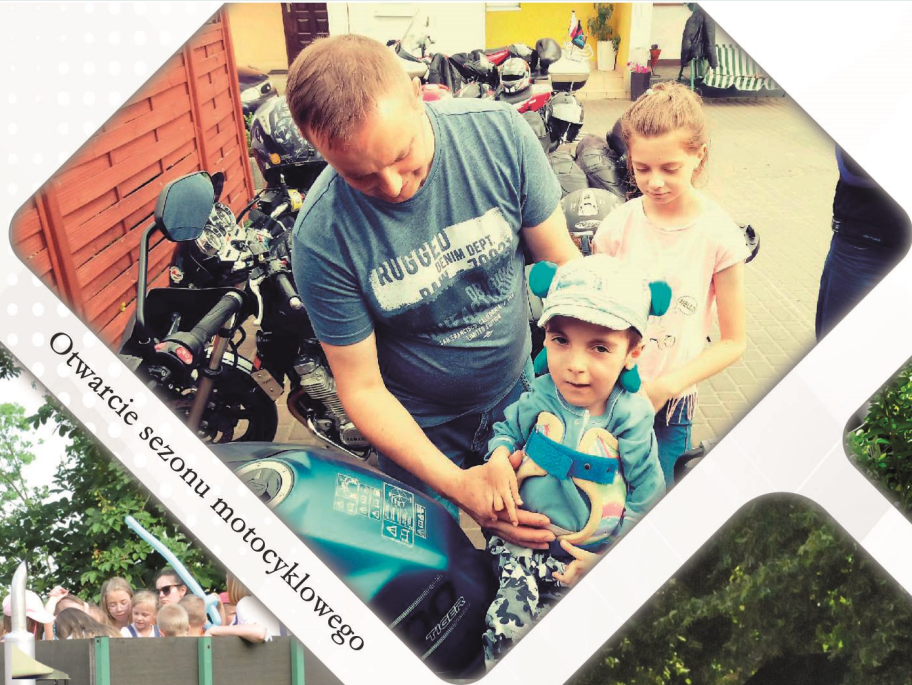
Otwarcie sezonu motocyklowego